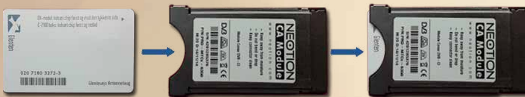
Sådan indsættes kort i modulet

Kortet skal sættes ind i CA modulet som vist på billedet nedenfor. Kortet skubbes helt ind i modulet, som efterfølgende indsættes i CI slottet på dit TV.