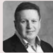
Artikel af Lars Knudsen Direktør Administrativ leder...