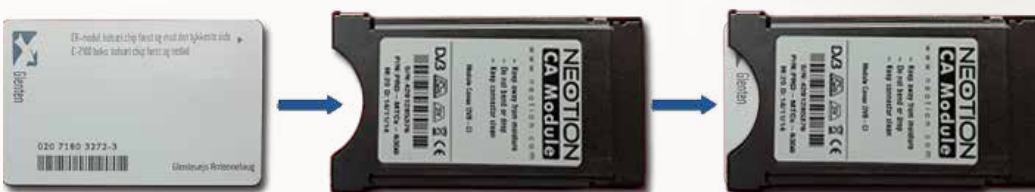
Sådan indsættes kort i modulet

Kortet skal sættes ind i CA modulet som vist på billedet nedenfor. Kortet skubbes helt ind i modulet, som efterfølgende indsættes i CI slottet på dit tv.