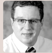
Artikel af Lars Knudsen Direktør